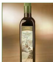
Olio Extravergine di