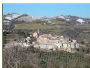
Cartoceto, Città dell'Oliva e dell'Olio (Pesaro-Urbino)