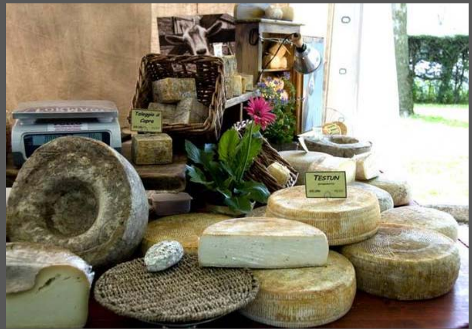
ALIMENTARE: A GUALDO VA IN SCENA FORMAGGI D'AUTORE 2012

- MACERATA - Andar per formaggi, conoscere, capire, gustare, un'esperienza tutta da godere nel centro storico di Gualdo. Sabato 19 e domenica 20 maggio, il piccolo borgo del Maceratese si anima per la XVI edizione di 'Formaggi d'Autore', mostra mercato dei formaggi d'Italia e dei prodotti tipici del territorio. 'Formaggi d'Autore' e' un po' mostra e fiera, un po' mercato e festa. La manifestazione, appunto, permette per due giorni di assaggiare, annusare, toccare, comprare numerosi tipi di formaggio provenienti da tutte le regioni d'Italia. In 'mostra', formaggi a pasta molle, dura, filata, pressata, erborinata, proposti e venduti da selezionatori, istituzioni, consorzi, pastori scesi dagli alpeggi o casari riuniti in un Presidio Slow Food (Presidio del Caciocavallo del Gargano, Caciocavallo di Cimina' della Calabria, il Castelmagno d'Alpeggio, la Tuma di pecora delle langhe il raro Pecorino dei Monti Sibillini). Nei due giorni in programma anche i Laboratori del gusto, dove e' possibile fare piacevoli esperienze sensoriali per conoscere in maniera concreta e consapevole le tecniche e il contesto culturale in cui nasce un prodotto alimentare. Gli esperti dell'Onaf, coadiuvati dalla partecipazione attiva di produttori, allevatori e studiosi, guideranno i visitatori nella degustazione alla scoperta del 'pianeta' formaggio. Si parlera' anche dei 'misteri delle muffe'. Nell'osteria allestita per l'occasione, diversi chef delle Marche