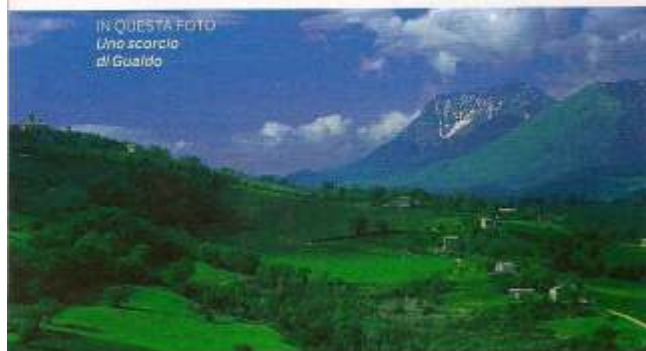
IN QUESTA FOTO Uno scorcio di Gualdo